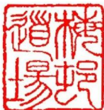
Plum Village pecsétje